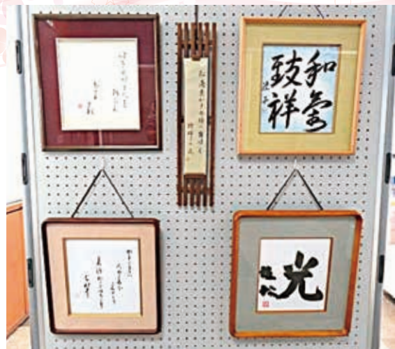
令和8年2月5日から18日まで作品展示コーナーで展示された作品です

日本文化である「書」を大切に、一筆一筆、気持ちを入れて……老若男女、障害のある方ない方、皆で書を楽しんでいます。