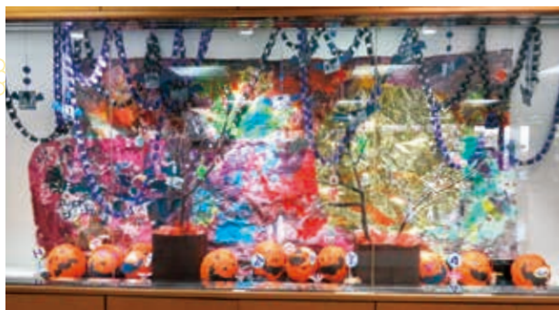
さくら草学園の作品