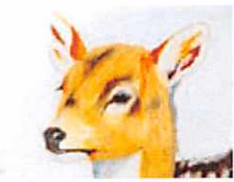
「まなざし」(クレヨン画)