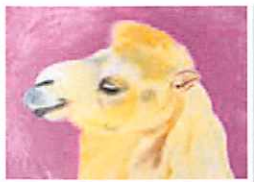
「溫和」(オイルパステル画)